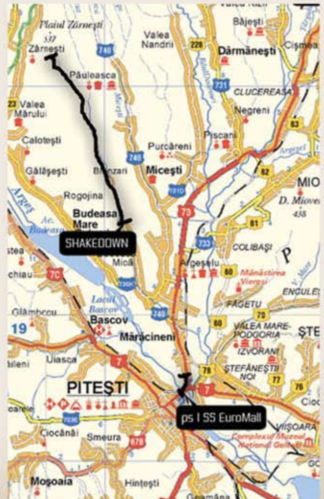
SHAKEDOWN - P.S. 7 SUPERSPECIALA