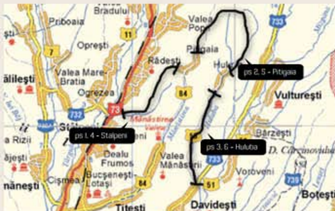
HARTA ETAPA I - P.S. 1.2.3.4.5.6