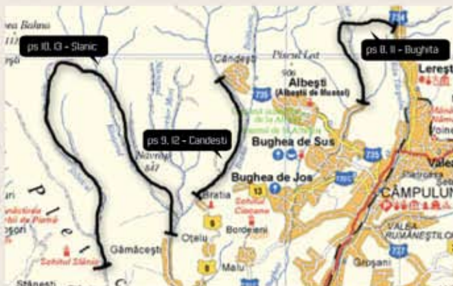
HARTA ETAPA II - P.S. 8.9.10.11.12.13